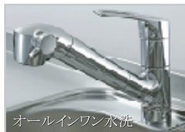
オールインワン水洗