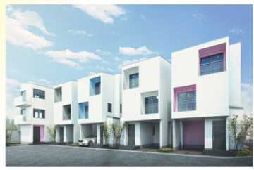
※図面と現状が相違する場合は、現状を優先いたします。