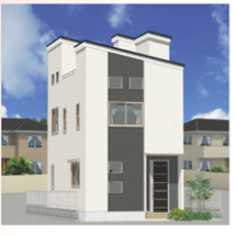
※図面と現状が相違する場合は、現状を優先いたします。