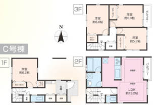
※図面と現状が相違する場合は、現状を優先いたします。