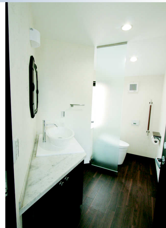
■トイレ 開放的なトイレ。広い空間を確保しました。